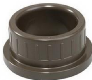
ЗАГЛУШКИ РОЗЕТОК U-PVC K62