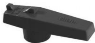
РУКОЯТКА KRYOCLIM® И GIRAIR® Ø 20 to 63