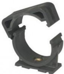
ДЕРЖАТЕЛИ MONOKLIP® Внутренний размер 7 x 150 Ø32 - 63