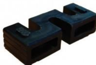
КОМПЛЕКТУЮЩИЕ ДЛЯ ДЕРЖАТЕЛЕЙ MONOKLIP® Ø 75 ДО 110 20 мм высота – совместимы только с MONOKLIP® НСКК 75 до 110