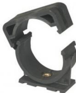
ДЕРЖАТЕЛИ MONOKLIP® Внутренний размер M6 Ø25 - 63