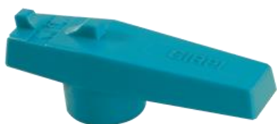
РУКОЯТКА SYSTEM'O® Ø16 to Ø63