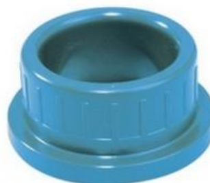
ЗАГЛУШКИ РОЗЕТОК GIRAIR®