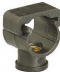
ДЕРЖАТЕЛИ MONOKLIP® Внутренний размер M6 Ø16 - 20