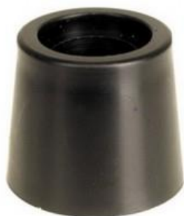
ПРИЗМА ДЛЯ ДЕРЖАТЕЛЕЙ MONOKLIP® Ø 16 ДО 20 20 мм высота