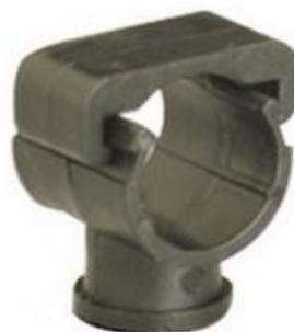
ДЕРЖАТЕЛИ MONOKLIP® Внутренний размер Ø 5.5мм Ø16 - 20