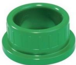
ЗАГЛУШКИ РОЗЕТОК KRYOCLIM®