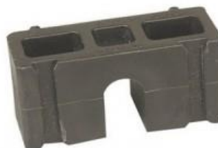
КОМПЛЕКТУЮЩИЕ ДЛЯ ДЕРЖАТЕЛЕЙ MONOKLIP® Ø 25 ДО 63 20 мм высота – совместим только с MONOKLIP® держателем НСКК 25 до 63