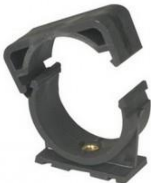
ДЕРЖАТЕЛИ MONOKLIP® Внутренний размер M8 Ø25 - 63