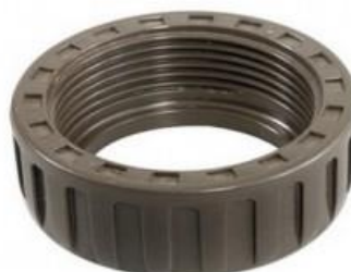
ОПОРНЫЕ ГАЙКИ HTA®