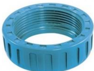
ОПОРНЫЕ ГАЙКИ GIRAIR®