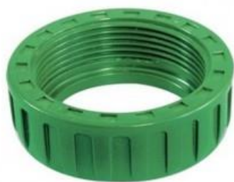
ОПОРНЫЕ ГАЙКИ KRYOCLIM®