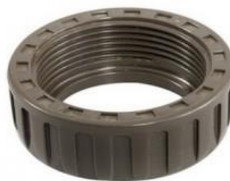
ОПОРНЫЕ ГАЙКИ U-PVC K62