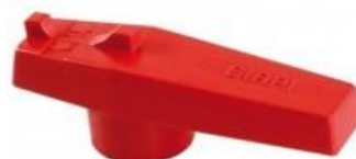
РУКОЯТКА SYSTEM'O® И PVC-U K62 Ø 16 to 63